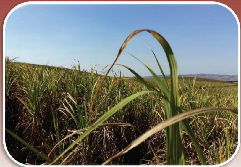
Riet onder stres