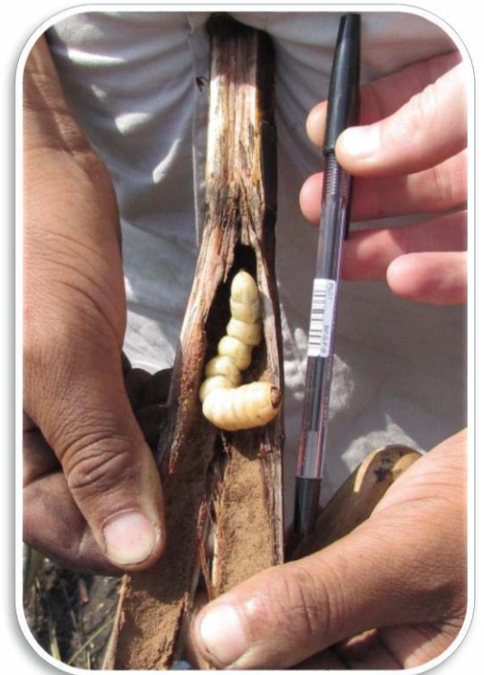
Larwe in stronk