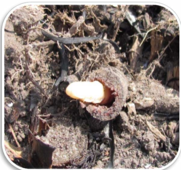
Larwe in rietstoppels