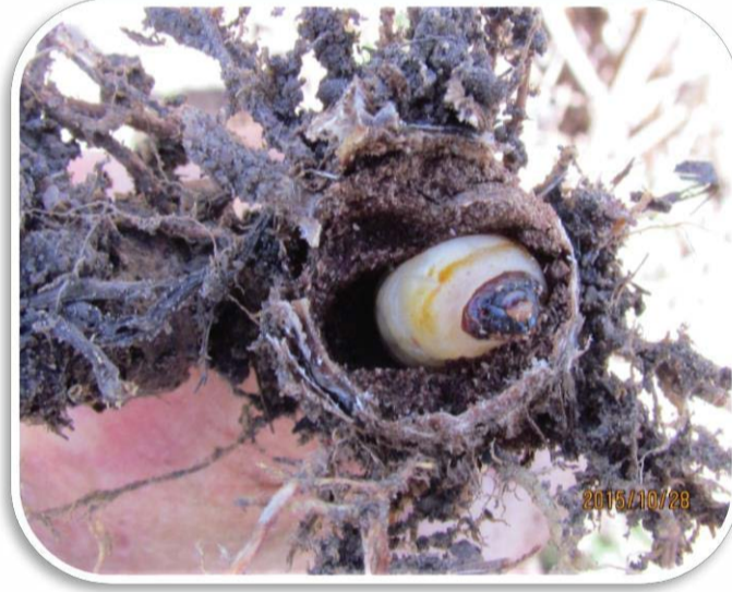
Larwe in stronkbasis