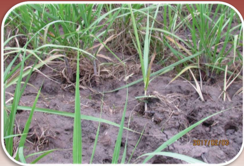
Vark skade mag 'n aanduiding wees van moontlike larwe skade.

U samewerking word versoek om op die uitkyk te wees vir die pes soos hieronder geïllustreer.