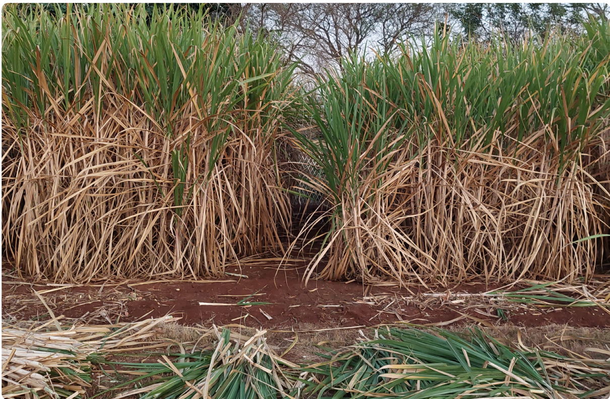
Figuur 2: Gesonde riet (links) in vergelyking met RSD besmette riet (regs).

Vir meer inligting oor RSD, verwys na SASRI-inligtingstuk 9.1